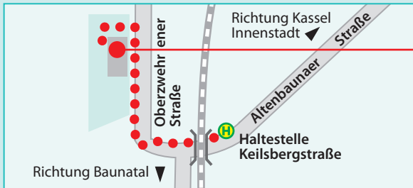
Ausbildungs- und Qualifizierungszentrum (AQZ) Kassel-Oberwehren