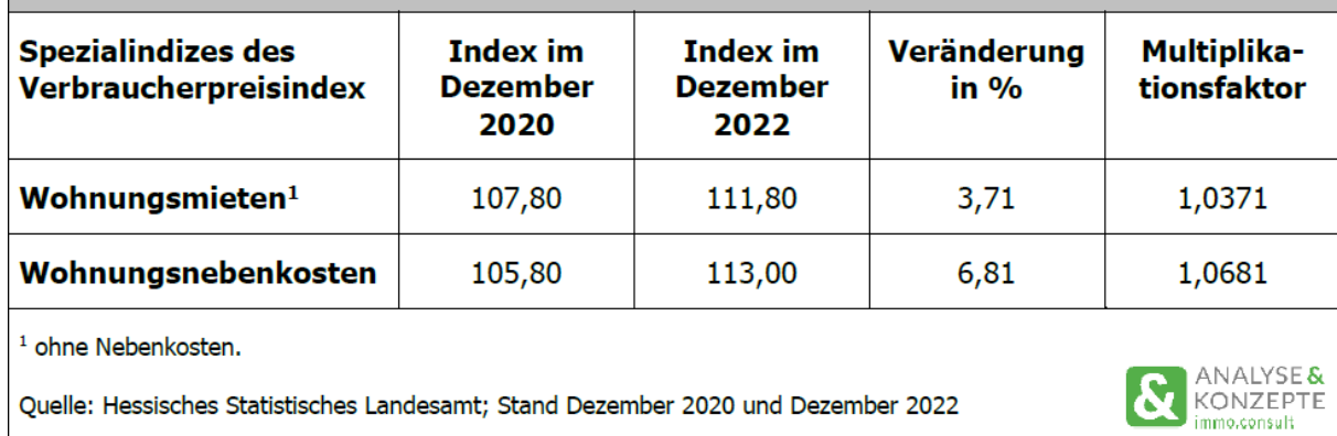
Tab. 1 Spezielle Verbraucherpreisindizes Hessen (Basis 2015 = 100)

Ergänzend zur Fortschreibung der bisherigen Bruttokaltmieten des Schlüssigen Konzeptes wurde auch das aktuelle Angebot an Mietwohnungen im Landkreis Kassel geprüft.